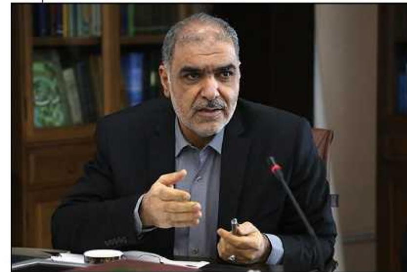
بازدید معاون وزیر راه و شهرسازی از پروژه های راه سازی کرمان - زرنند ، چترود - راور و پروژه صاروج پارس