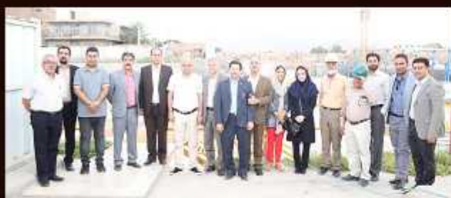
بازدید هیئت عمانی از پروژه صا روج پارس و کارخانه آسفالت در راستای همایش بازار عمان و فرصتهای صادراتی استان کرمان