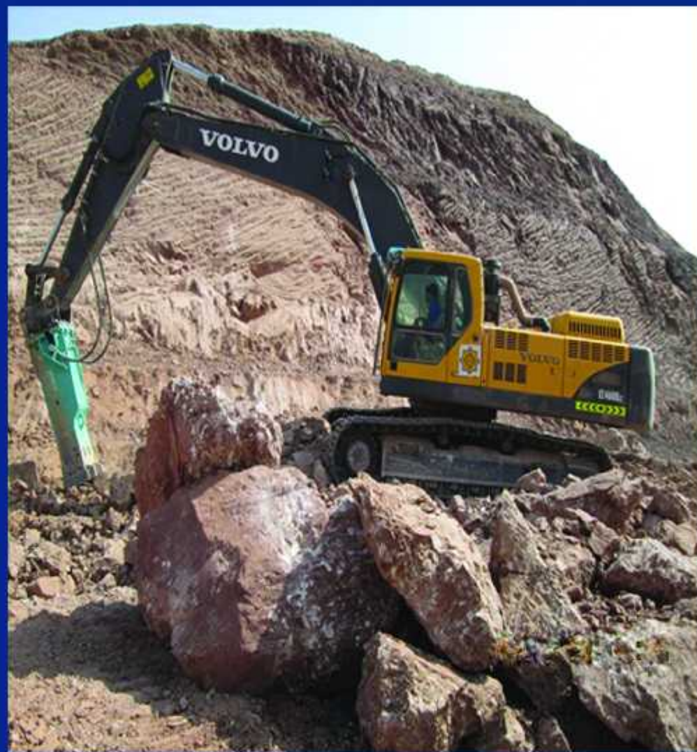
احجام اجرایی سه ماه سوم ۱۳۹۸ پروژه کرمان - زرنند

محور « چترود - راور » از محورهای ترانزیتی و پرترافیک استان کرمان است که به دلیل کم عرض بودن و متناسب با ترافیک ۳۰ سال قبل در این محور شاهد تصادفات زیادی در چند سال قبل بوده ایم. به دلیل عدم تامین منابع مالی از طرف کارفرما و عدم تایید تخصیص تعدیل روستای به قرارداد هیچ فعالیتی انجام نشده است.