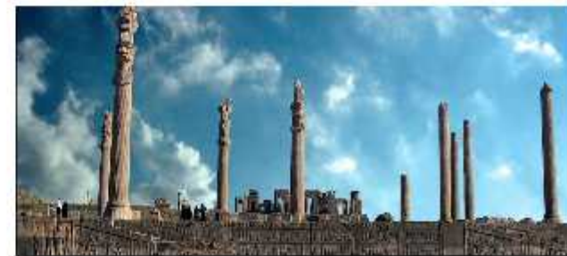
نیایشگاه پارسه در کنار آپادانا

در این کاخ می شود نقوشی از سربازان هخامنشی و سربازان ماد را در کنار هم دید. به این شکل پادشاه نشان می داد که بر سلسله قبلی ایران نیز تسلط کامل دارد. در این نقوش سربازان ماد کلاه می دور و سربازان هخامنشی کلاه استوانه ای شکل دارند. این کلاه ها وضعیت رسمی مجلس را به تصویر می کشند. به غیر از مادها و پارس ها نقوشی از ملت های دیگر نیز در این تالار به چشم می خورد. این مهمان ها در حال تقدیم هدیه به داریوش کبیر تصویر شده اند.