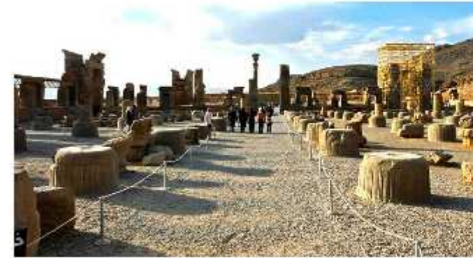
کاخ سه در

نزدیک ترین کاخ به تالار صد ستون کاخ سه در است که به خاطر تعداد درهایش یا این نام خوانده می شود. این کاخ در زمان اردشیر اول کامل شده است. نقش نجیب زادگان پارسی بر روی دیوار بلکان این کاخ، این نظریه را قوت بخشیده است که از کاخ سه در برای شور و مشورت بزرگان استفاده می کرده اند. به همین دلیل به کاخ سه در، کاخ شوراها نیز می گویند. کاخ سه در، در مقایسه با آپادانا و تالار صد ستون چندان بزرگ نیست، اما از قسمت های قدیمی این مجموعه به حساب می آید.