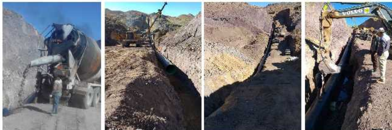
بتن ریزی آبراهه خط خط لوله خط لوله خط لوله