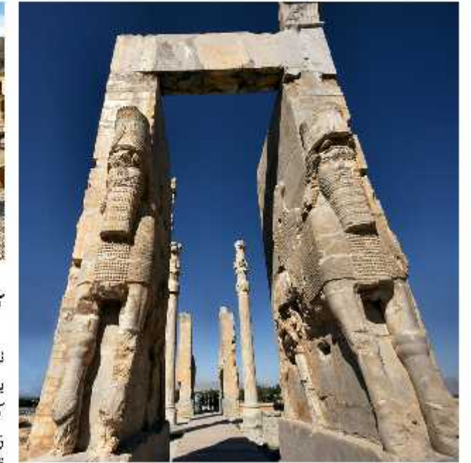
تالار صد ستون

بعد از بازدید از کاخ سه در به مهم ترین بنا در مجموعه پارسیه می رسیم. این قسمت بارگاه یکی از قدرتمندترین پادشاهان تمام تاریخ یعنی داریوش بکم بود. داریوش به عنوان بنیان گذار مجموعه تخت جمشید، کاخی به همین نام در شوش نیز ساخته بود که اتفاقاً شباهت هایی به آپادانا پارسیه دارد. در ساخت هر دو از آجرهای لعاب دار و تزئیناتی مشابه استفاده شده است. همچنین ۷۲ ستون این دو کاخ نیز بی شباهت به هم نیستند.